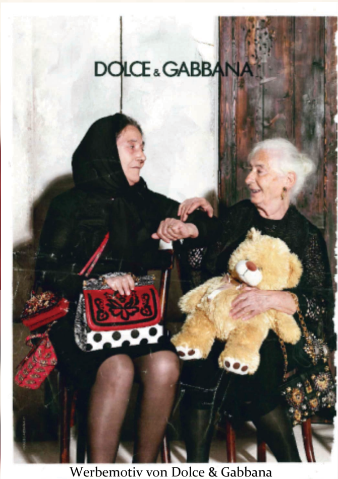
Werbemotiv von Dolce & Gabbana